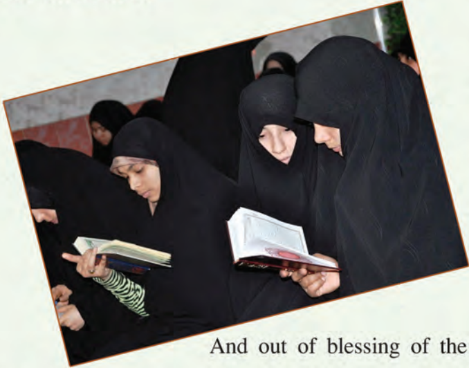
And out of blessing of the

It is by blessings of Imam Hussin (a.s.) that hearts from different territories of the world feel in love with him, as Islam was and still of Mohammadian orign and Hussaini continuation.