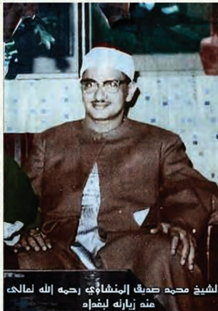
الشيخ محمد صديق المنشاوي رحمه الله لوالده منه زيارته لبيضاء

ولما علمت إدارة الإذاعة المصرية بتلك الموهبة أرسلوا إليه يطلبون منه أن يتقدم بطلب للإذاعة؛ ليُعقد له اختبار فيُعتمد مقرئاً بها، فرفض الشيخ، فما كان من مدير الإذاعة إلا أن أمر بأن تُنقل الإذاعة إلى حيث يقرأ الشيخ محمد صديق المنشاوي، فكانت تلك أول حادثة في تاريخ الإذاعة أن تنتقل بمعدات وكادرها؛ لتُسجّل لأحد المقرئين، وبعد إلحاح شديد ذهب الشيخ محمد صديق المنشاوي للإذاعة واستكمل تسجيلاته، وظلّ قارئاً بالإذاعة إلى أن توفاه الله تعالى.